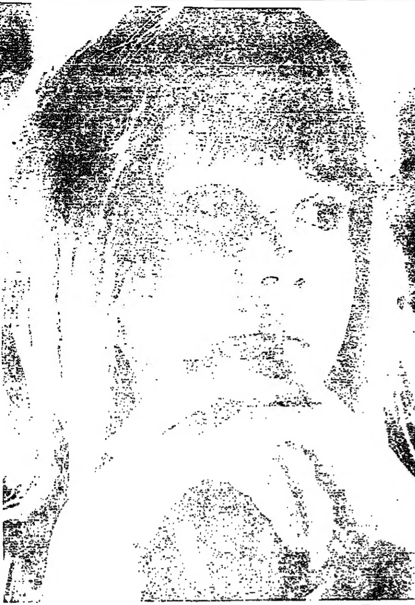
ميجر بيلانج وحبيبا من خالصة خالصة

يوم وفاة الممثلة ، على عكس ما تكرر من خلال التحقيق الذي أعقب وفاة مارلين ، بل يبدو أن أحد الشهود رأى روبرت كينيدي وهو يدخل منزل مارلين وصاحبه رجل يحمل حقيبة طبية ، وذلك قبل ساعات قليلة من اكتشاف الجثة . وكان من الغريب أن تتناول مارلين العشاء ، عشية وفاتها ، في منزل بيتر اونورد زوج شقيقة الرئيس كينيدي ، ولقها انشرت تليفونيا من مسند الحضور . وقد أشار المقال أيضاً الى وجود تسجيلات على الشرطة تحفظت نسخة للشهيات بين مارلين وجون كينيدي ، وقد اخذت هذه الترافات ، مما يبرر دافعا محتملا للقتل . وهذه تقرير سري بعنوان « جريمة مارلين مونرو » من ٧٢٢ صفحة ، كان